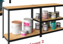
Вариант сборки 2