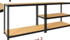
Вариант сборки 2