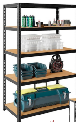
Вариант сборки 1