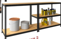
Вариант сборки 2