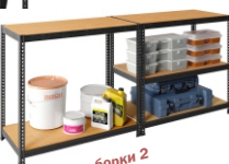
Вариант сборки 2