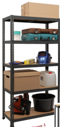
Вариант сборки 1