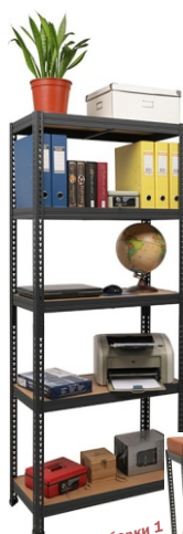
Вариант сборки 1