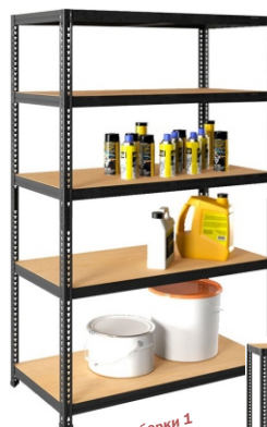
Вариант сборки 1