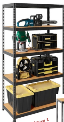
Вариант сборки 1

КОМПЛЕКТАЦИЯ: Стойка SBL – 8 шт. Соединитель стоек SBL – 4 шт. Балка продольная SBL – 10 шт. Балка поперечная SBL – 10 шт. Стяжка балок SBL – 5 шт. Настил ДВП – 5 шт. Подпятник пластиковый – 8 шт