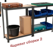
Вариант сборки 2